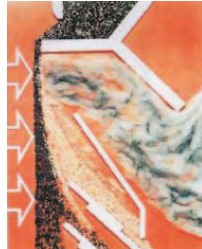
OBセパレーター内部